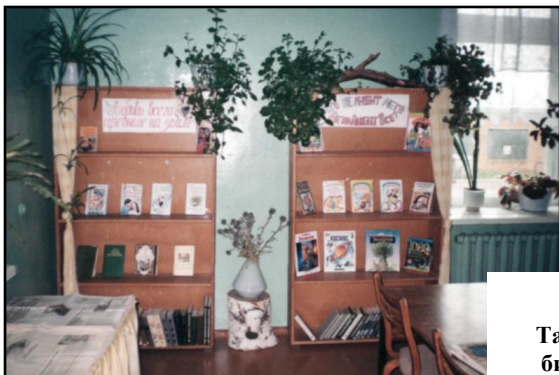
Интерьер Тавлинской библиотеки