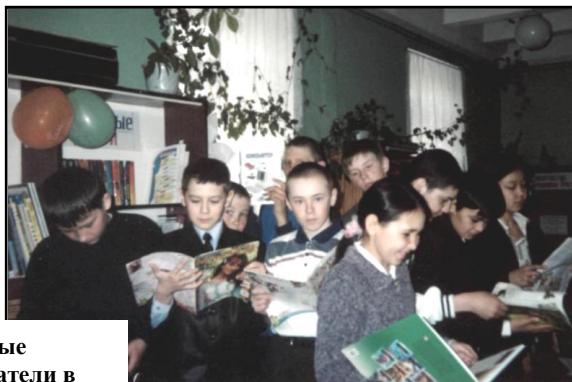
Юные читатели в библиотеке