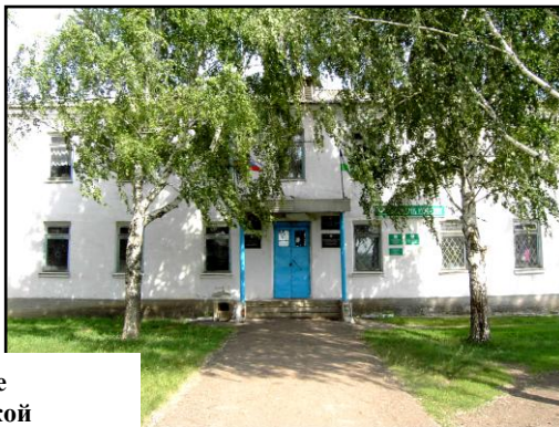
Здание сельской администрации

Сегодня библиотека размещается снова в здании администрации. Здесь домашнему уютно, все располагает к чтению и беседе.